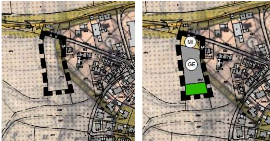
Abb. 2: Ausschnitt aus dem Flächennutzungsplan (links) und aus der 10. Änderung (rechts), Stand: 13.01.2026, Vorentwurf

Der Flächennutzungsplan entspricht an dieser Stelle nicht mehr den aktualisierten Zielvorstellungen der Gemeinde und wird daher im Parallelverfahren geändert.