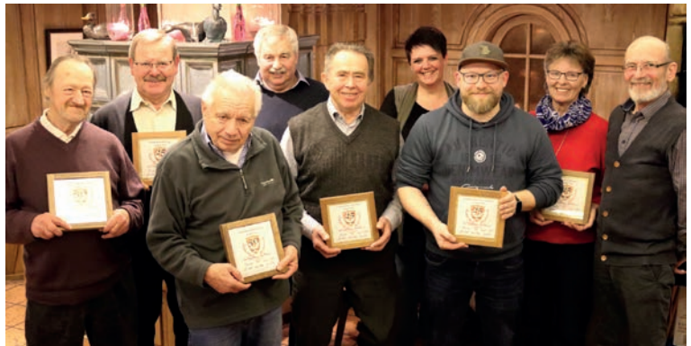
Ehrung der langjährigen Mitglieder

Als zweiter Punkt stand die Spendenübergabe aus dem Reinerlös