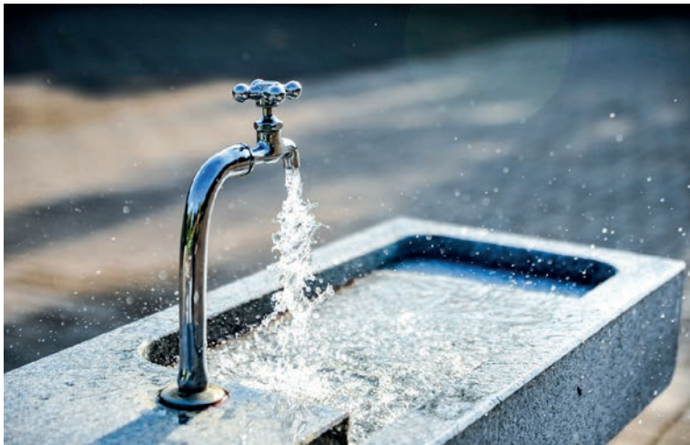
Höhere Verbrauchspreise im Wasserzweckverband Paunzhausen

So kommt es dazu, dass insbesondere bei hohen Wartungsaufwänden, steigenden Personalkosten oder unvorhergesehenen Problemen, eben nicht aus (leider