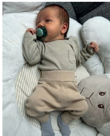
... zur Geburt von Nicolas-Ioan Lapadat aus Burghausen am 18. Januar 2024 (rechts)