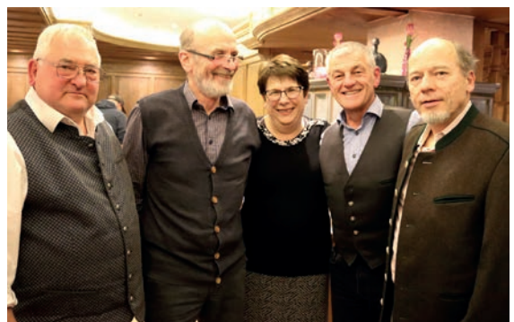
Die alte und neue Vorstandschaft