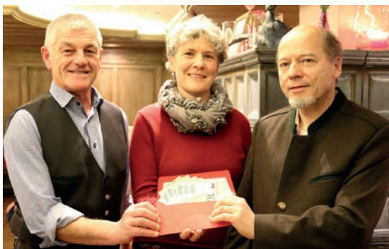
Übergabe der Spende an das Frauenhaus Freising